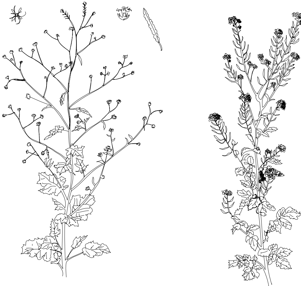
Abbildung aus: Das Messéqué Heilkräuter Lexikon, Molden